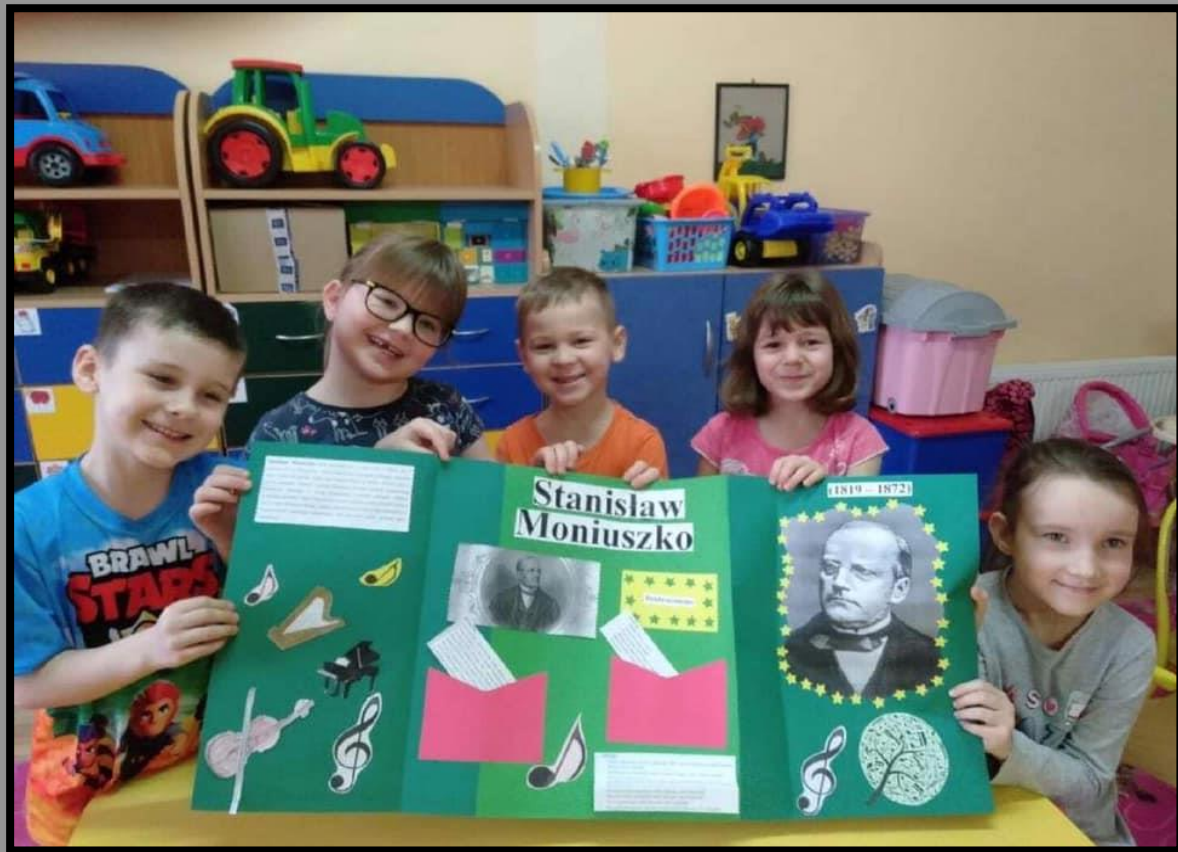
Lapbooki w wykonaniu 6-latków.